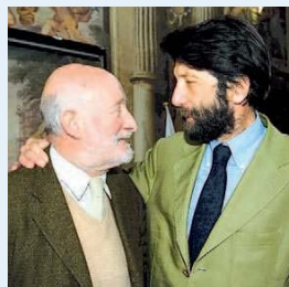
▲ Amici Vittorio Gregotti con Massimo Cacciari a Milano nel 2002

strutture materiali, si tratta di forme di vita. Se non è tutto questo l'architettura muore. Muore infatti diceva Manfredo Tafuri. Nient'affatto, non deve , risponde Vittorio. Amicizia, grande stima tra loro. Manfredo