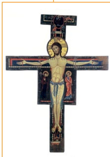
Crocefisso del Duomo di Spoleto.