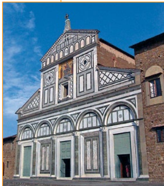
Basilica di San Miniato a Firenze, iniziata nel 1018.