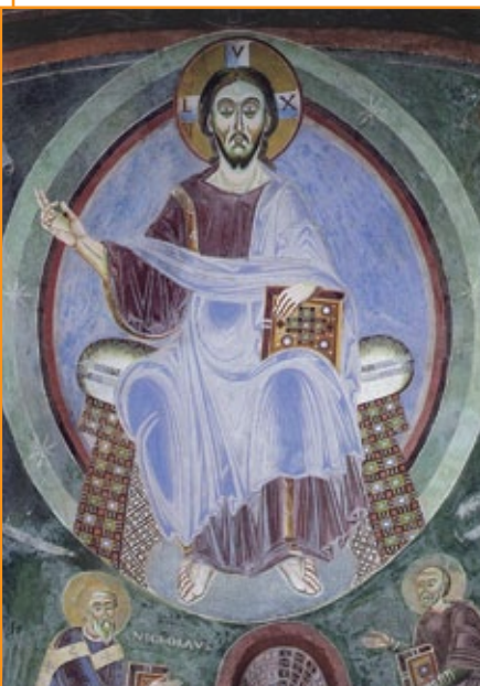
Affresco della Cappella di S. Eldrado, abbazia di Novalesa (Torino), XI sec.