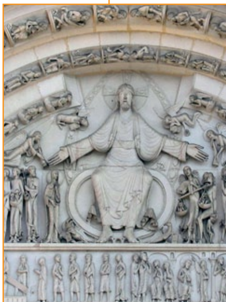
Basilica della Madeleine a Vézelay, 1125.