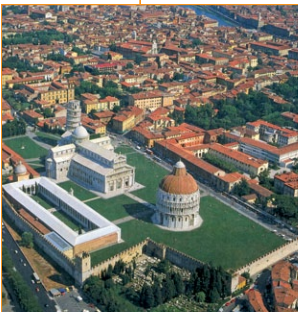
Campo dei miracoli a Pisa, 1118.