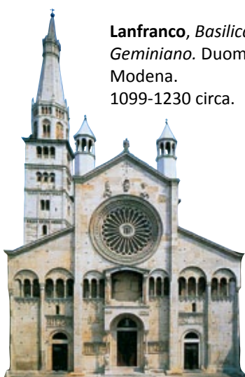
Lanfranco, Basilica di San Geminiano . Duomo di Modena. 1099-1230 circa.

La chiesa romanica è un organismo complesso ma organizzato con chiarezza. Osservando la facciata si comprende la struttura dell'edificio. L'interno è un ambiente sobrio e accogliente , adatto alla preghiera.