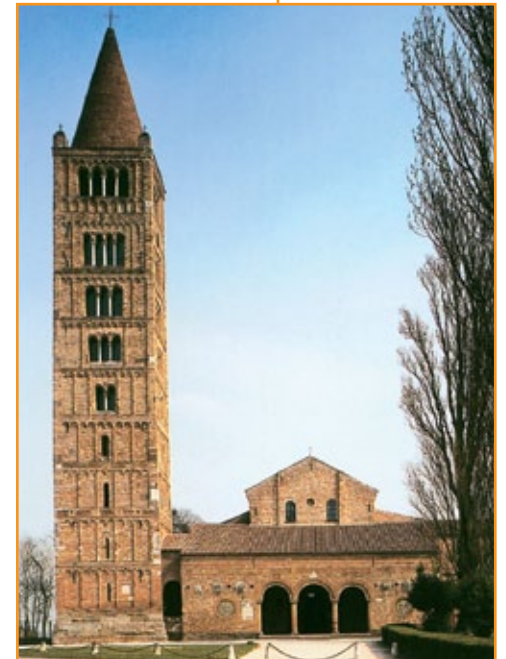
Abbazia di Pomposa presso Ferrara, 1063.