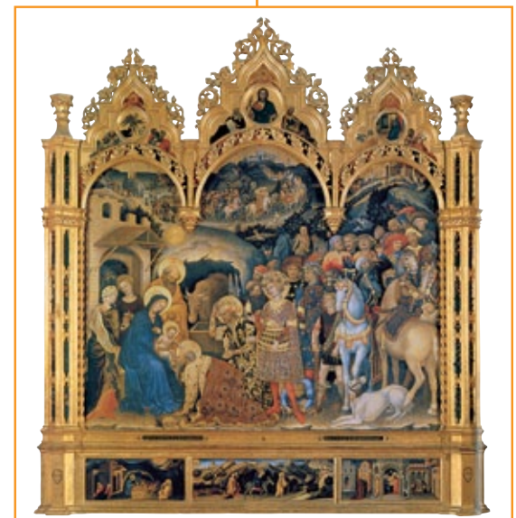
Gentile da Fabriano, Adorazione dei magi , 1423.