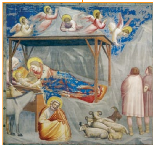
Giotto, La natività di Gesù , 1303. Padova.