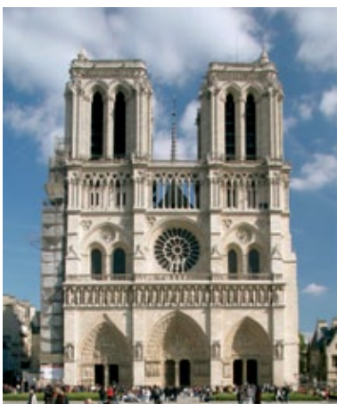
Facciata della Cattedrale di Notre-Dame, Parigi.

La cattedrale, proiettata verso l'alto, è rappresentazione della città celeste. L'uomo si perde al suo interno: i suoi spazi, inondati di luce, non sono misurabili.