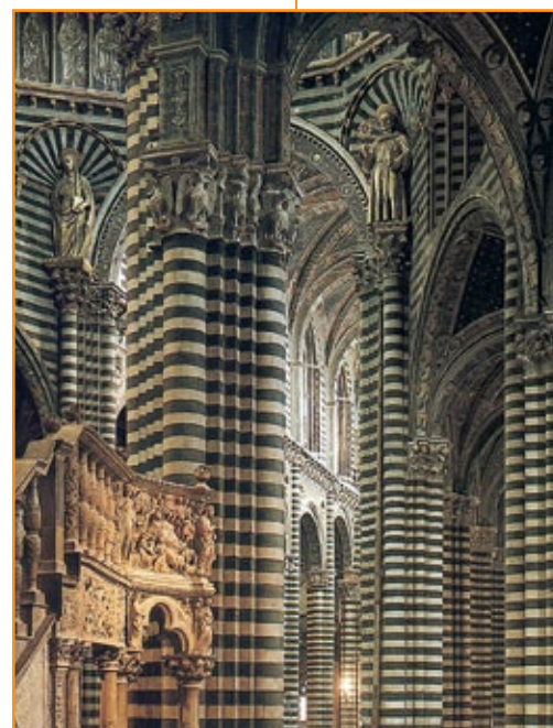
Duomo di Siena, interno, 1230.