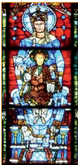
Vetrata della Cattedrale di Chartres, 1220. Francia.