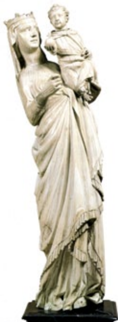
Giovanni Pisano, Madonna con bambino , 1298.