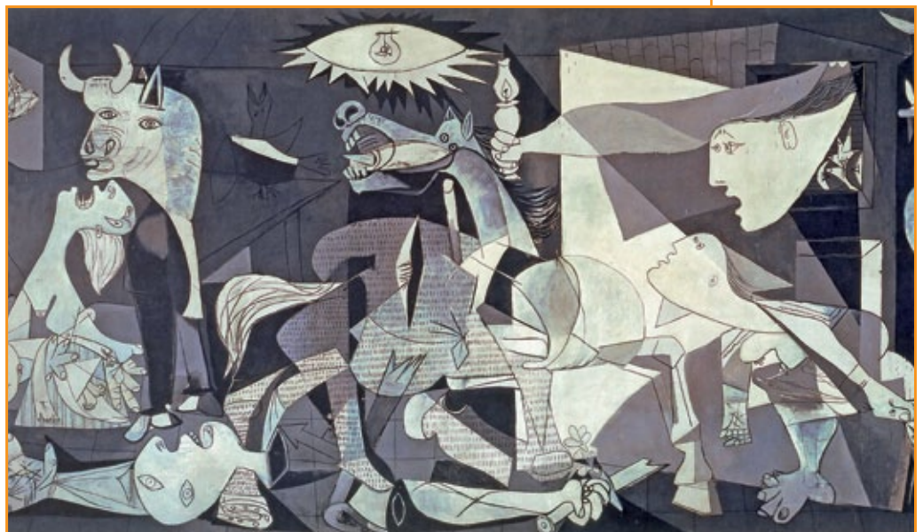
Pablo Picasso, Guernica , 1937.