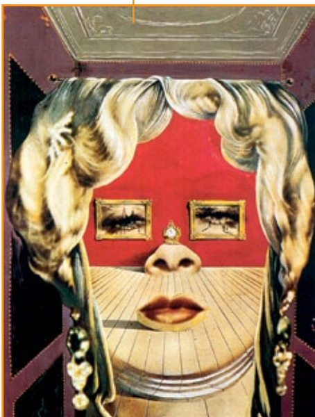
Salvador Dalí, Mae West , 1932.