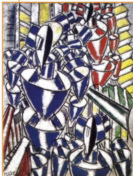
Fernand Léger , La scalinata , 1914.