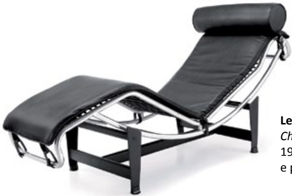
Le Corbusier , Chaise longue , 1929. Metallo e pelle.

Subito dopo però prevalse il razionalismo del Bauhaus e di Le Corbusier , con volumi puri e forme squadrate.