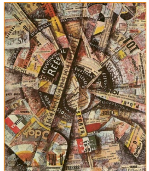
Carlo Carrà , Manifestazione interventista , 1914.