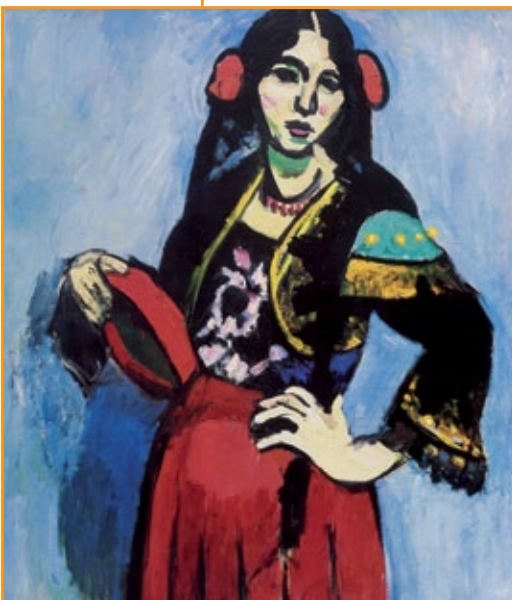
Matisse , Donna spagnola con tamburino , 1909.